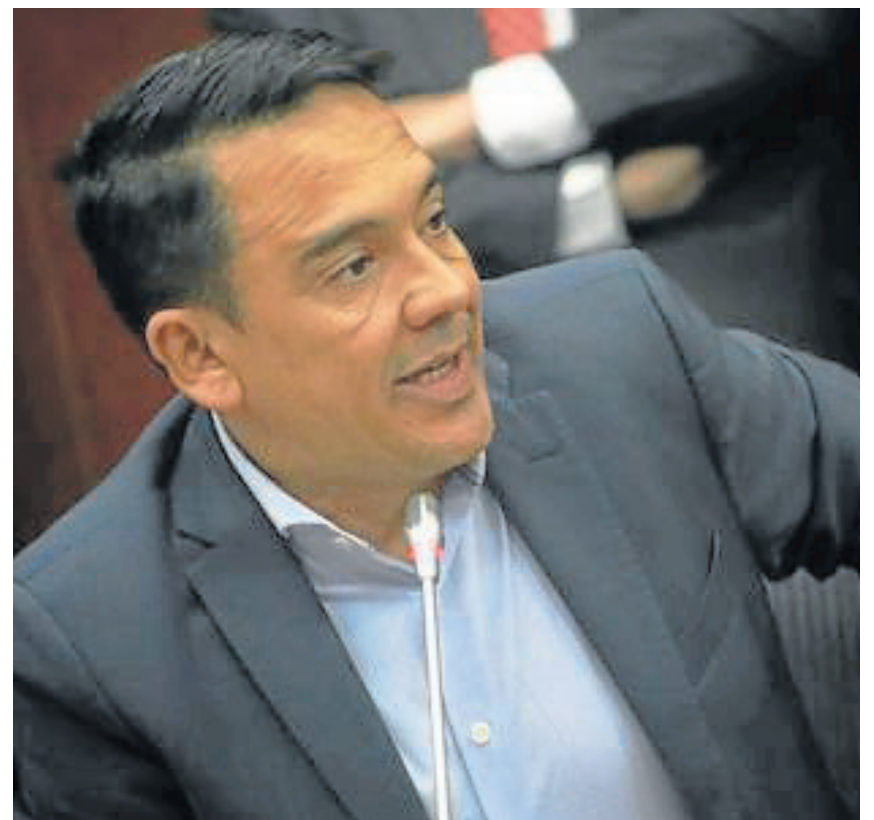
José Vicente Carreño, senador del Centro Democrático.

La Fiscalía imputó al asesor el delito de cohecho por dar u ofrecer. Sin embargo, un juez de control de garantías ordenó que el procesado cumpliera medida de aseguramiento no privativa de la libertad mientras avanza la investigación.