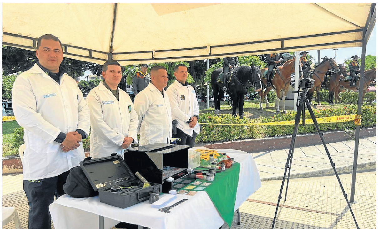
La policía del Tolima lanzó el plan navidad 'Familias Felices'.

Navidad sin violencia de género: a través de las Patrullas Púrpuras, la Policía Nacional en el Tolima enfocará sus esfuerzos en la protección a la mujer para prevenir hechos lamentables que puedan opacar la celebración de fin de año. A través de cam-