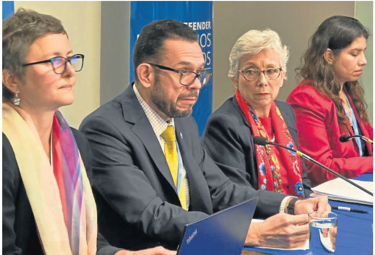
El Comité de la ONU contra la Desaparición Forzada dijo que hay “miles de cuerpos sin identificar” en diferentes lugares del país.

El ministro del Interior, Juan Fernando Cristo, pidió al relator para Colombia del Comité contra la Desaparición Forzada, que haga claridad sobre la denuncia de que hay en el aeropuerto de Bogotá un hangar con los cuerpos de 20 mil personas sin identificar.