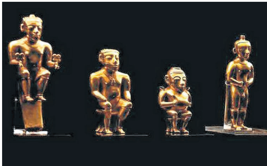
La colección fue obsequiada a la Corona española en 1893 por el entonces presidente colombiano Carlos Holguín.

cación correspondientes para comunicar al Comité cualquier inquietud sobre sus hallazgos preliminares y espera que el Comité precise sus alegaciones”, dijeron.