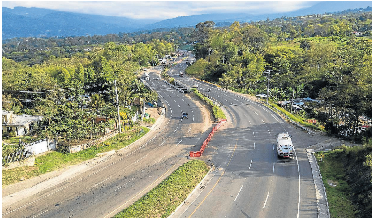
La construcción del tercer carril Bogotá - Girardot está en su recta final.

Con esta entrega, la Concesión suma 6 Unidades Funcionales terminadas y en el segundo trimestre del 2025 finalizará las obras en la Unidad Funcional 6 en Silvania, de acuerdo con el cronograma de obras establecido con la Agencia Nacional de Infraestructura (ANI).