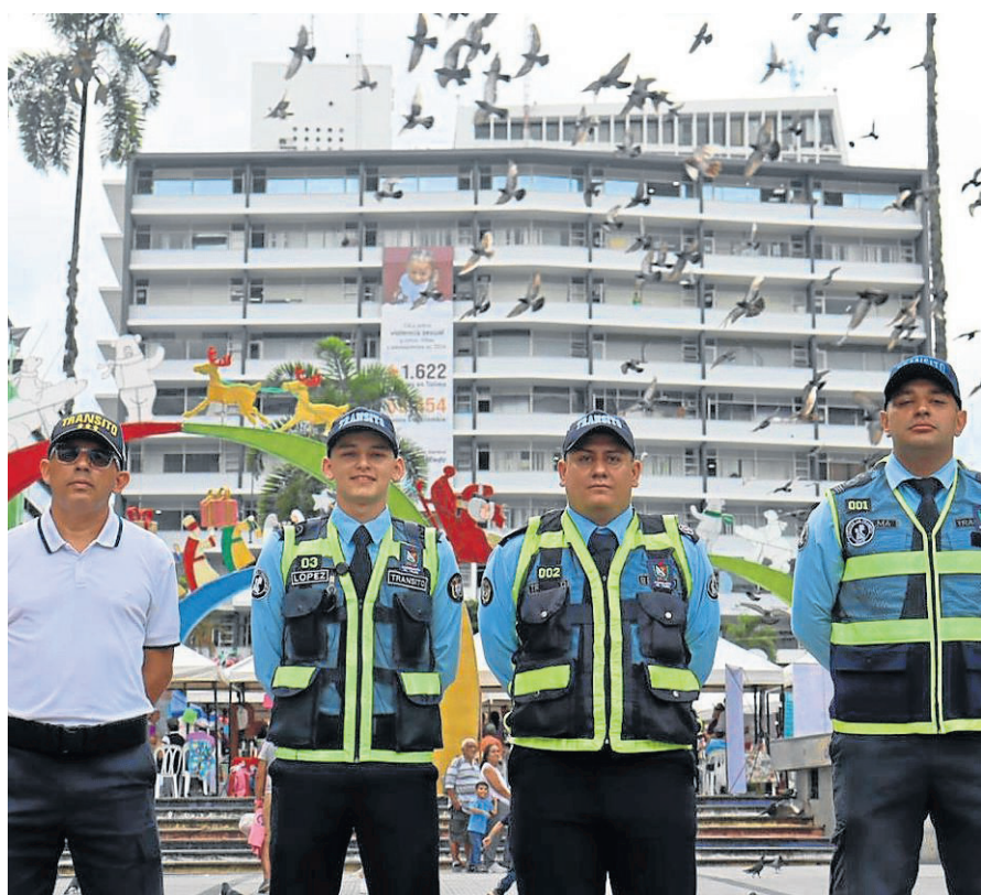
Empezará con un plan piloto de 4 agentes.